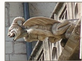
Mystérieuses chimères, mystérieux desseins...