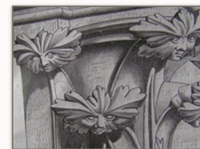
Les mystérieux visages d'Hommes Verts, dessin L.B.