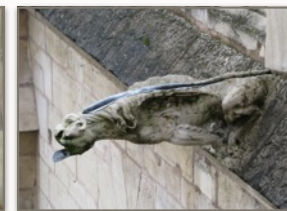
La gorge plombée rendue visible par l'angle de la photo.