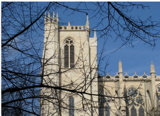
Ombres et lumières du Moyen Âge...

La primatiale Saint-Jean de Lyon a traversé les siècles, témoignage de l'art des bâtisseurs.