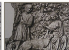
Légende de la chasse à la licorne