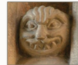
Le visage du démon, tapi au cœur de la lumière des vitraux...