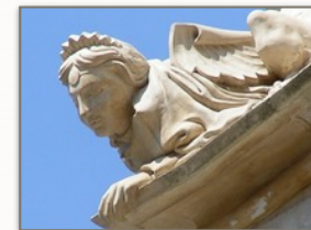
Une sphinge à l'affût, extérieur de la chapelle des Bourbons...